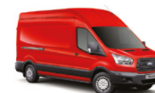
COLORADO RED - 4A7