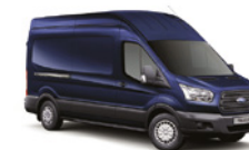
AZUL BÁLTICO - 3JV