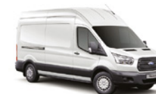
BLANCO OXFORD - 3GZ