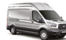
PLATA LUNAR - ZJB