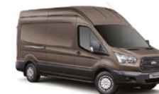
MARRÓN BRISBANE - 4AR